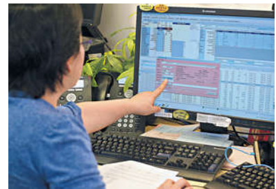
首輪市場演習模擬實際交易日情況，包括買賣、報價及沽空等，亦特別就其他特殊情況作出測試。