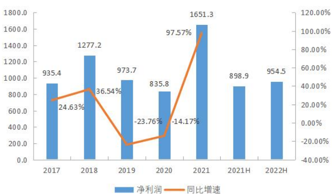
图 2: 2017 至 2021 年净利润情况 (人民币百万元)