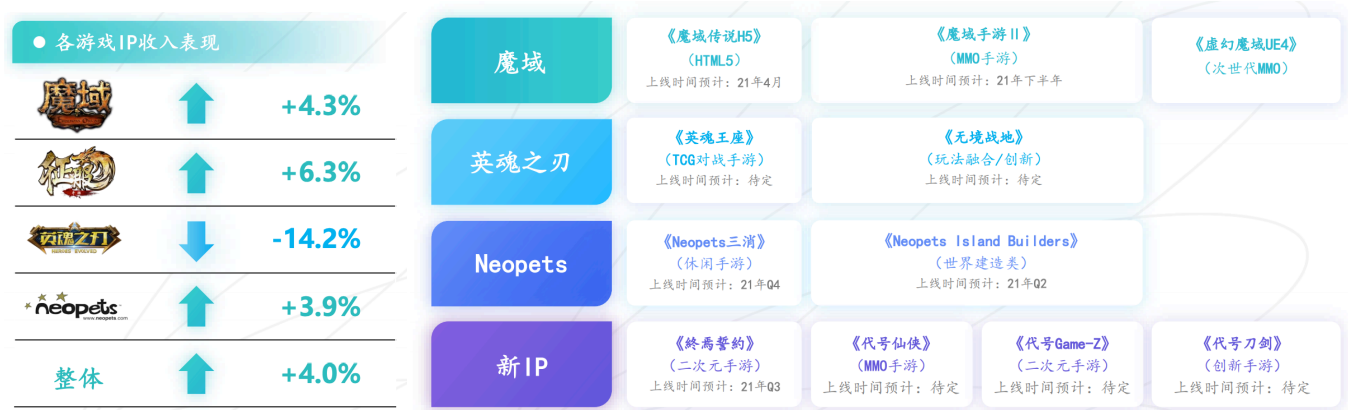
图 2：公司核心游戏表现及产品储备