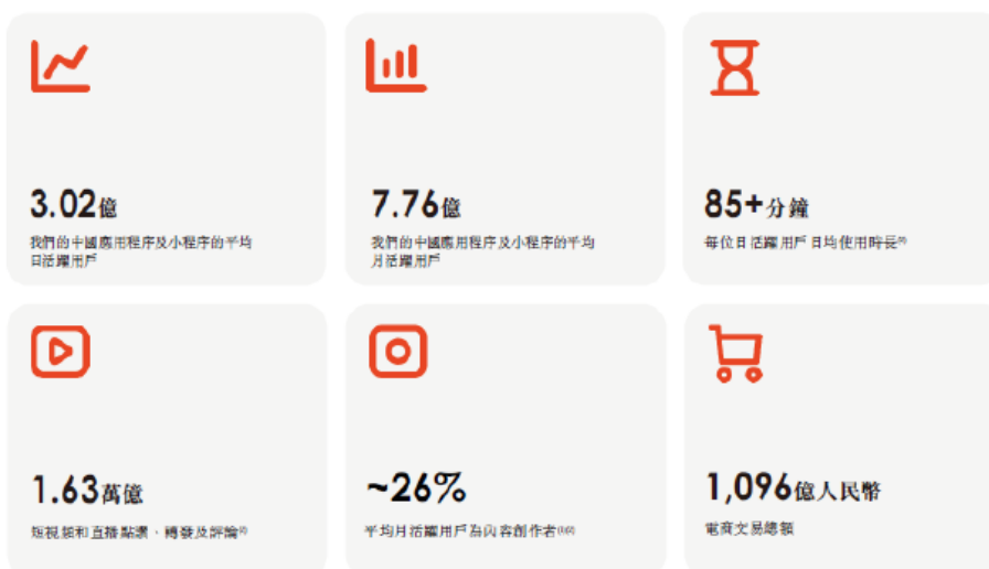
图 2：公司的用户规模及活跃度指标（截至 2020 年 9 月 30 日止九个月）