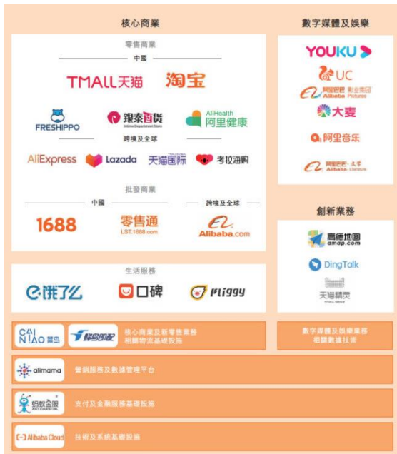
图 1: 公司核心业务介绍