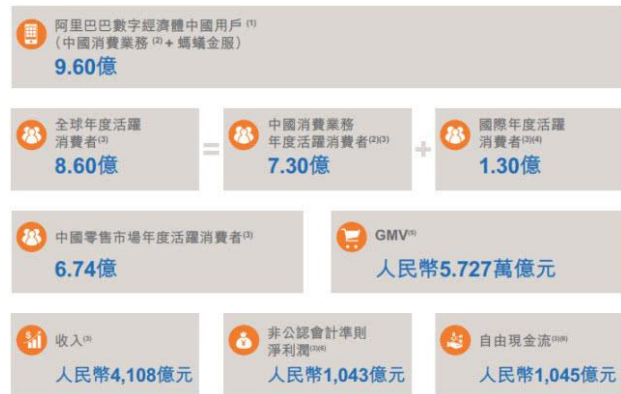
图 2: 公司目前业务表现情况